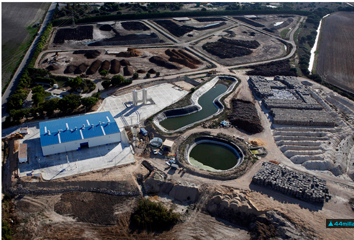
Cassandra Oils pilotanläggning i Spanien.